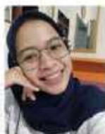
Penulis: Wahyu Lia Nurrohmah Staff Teknik Cabang Ponorogo

Untuk mengunjungi Telaga Ngebel, wisatawan hanya perlu menggunakan armada DAMRI yang berangkat dari Terminal Caruban pukul 06.05 dan 16.00 WIB , kemudian berangkat kembali dari Telaga Ngebel pukul 05.30 dan 15.00 WIB , tarif yang dikenakan Rp15.000 per orang .